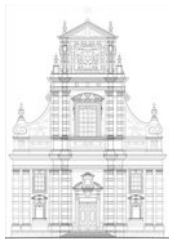
Les amis de Saint Loup